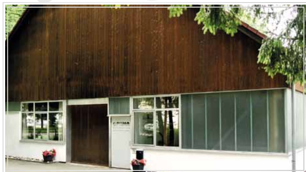
Produktionsgebäude in Geretsried - Bayern